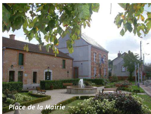
Place de la Mairie

Le centre ancien de Ligny-le-Ribault est implanté sur la rive Nord du Cosson. Il s'étend de la Place de l'Église à l'Est jusqu'à la Place de la Mairie à l'Ouest et du Cosson à la Rue du Prêche au Nord. Les principaux commerces de la commune y sont installés.