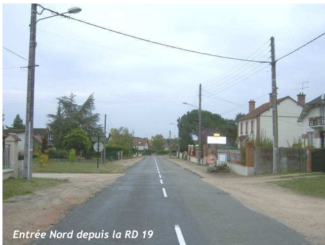
Entrée Nord depuis la RD 19

L'image du bourg varie selon les différentes entrées :