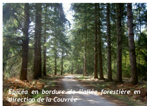
Épicéa en bordure de l'allée forestière en direction de la Couvrée