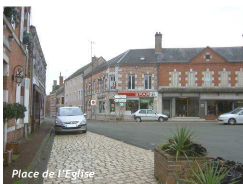
Place de l'Église