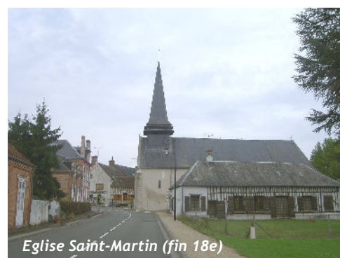
Eglise Saint-Martin (fin 18e)